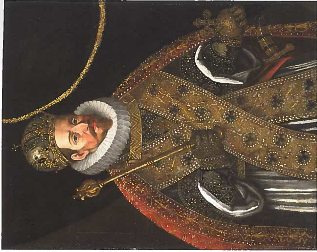
Císař Matyáš (1557-1619).